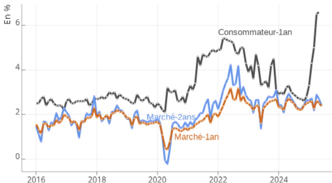
Graphique 2: Anticipations d'inflation des ménages et des marchés aux Etats-Unis